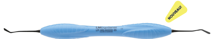
LM-Arte Modella DD LM442-443DDES