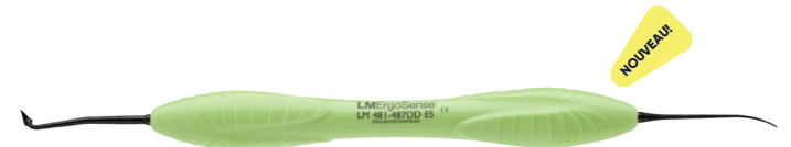
LM-Arte Fissura DD LM481-487DDES