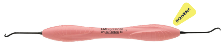
LM-Arte Eccesso DD LM307-308DDES