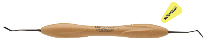
LM-Arte Applica DD LM46-49DDES