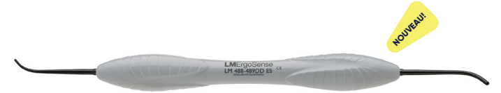
LM-Arte Condensa DD LM488-489DDES