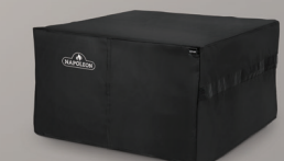
OPTIONAL UV PROTECTED FITTED COVER