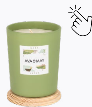
ŚWIECE ZAPACHOWE 180g | 40 godz.

W AVA & MAY z pewnością znajdziesz coś odpowiedniego dla siebie – firma oferuje olbrzymi wybór produktów do dekoracji wnętrza!