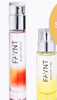
PERFUMY 10-50 ml zapachów na każdą okazję