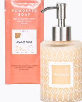
MYDŁA W PROSZKU saszetka na 200ml ekologicznego mydła