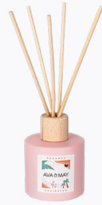
DYFUZORY ZAPACHOWE 100 ml