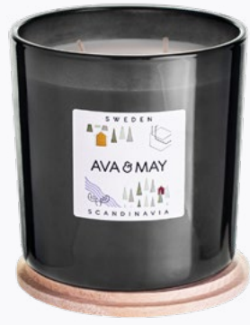
DUŻE ŚWIECE ZAPACHOWE 500g | 70 godz.