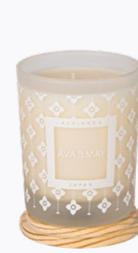
ŚWIECE DO MASAŻU 140g | Około 10 masażu pleców