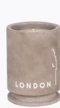
ŚWIECE BETONOWE 220g | 45 godz.