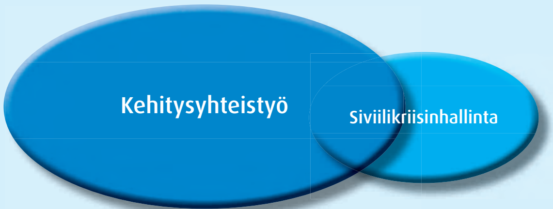
Kuva 2. Kehitysyhteistyön ja siviilikriisinhallinnan suhde