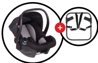
alpha™ & universal car seat adaptor