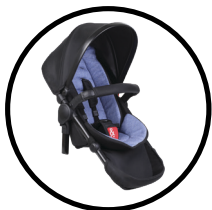
double kit™ / voyager™ main seat