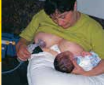
PAMU E ALU I LE ELETISE