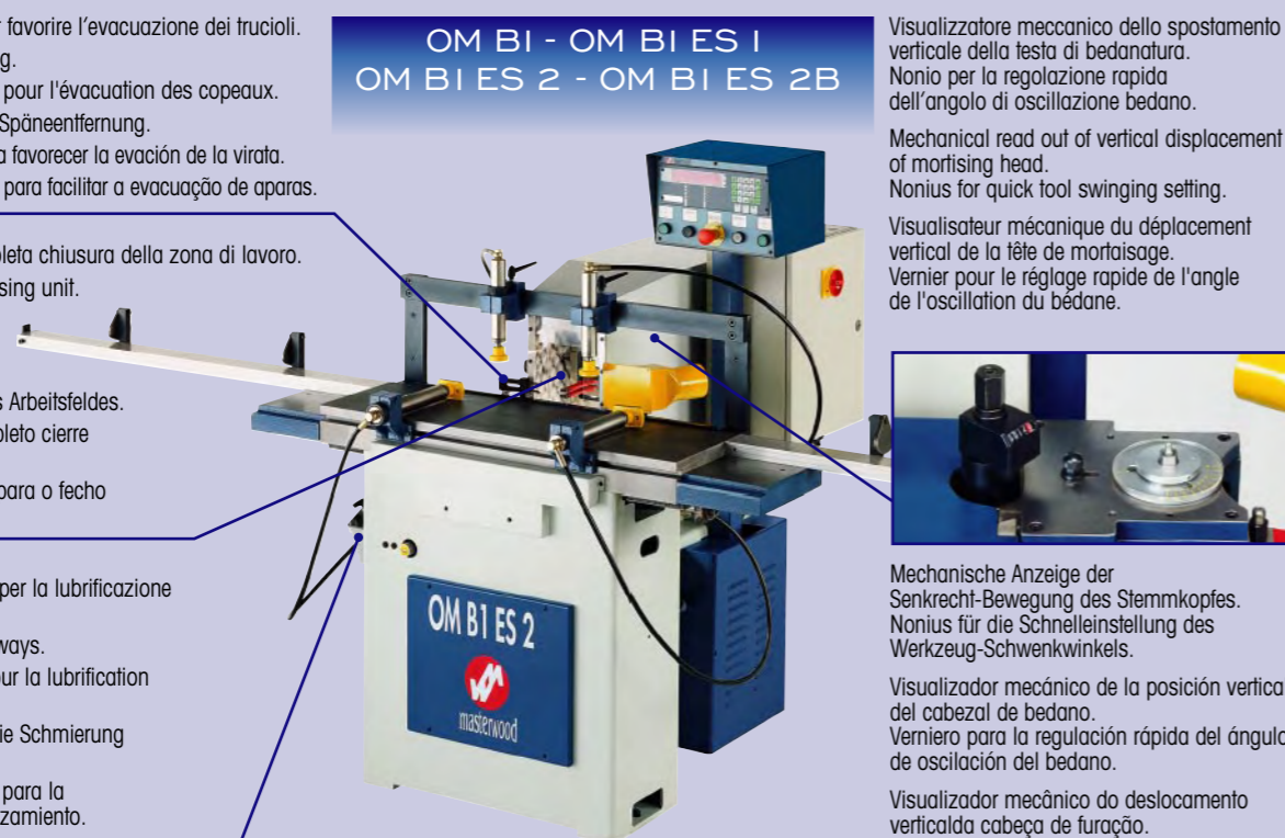
OM BI - OM BI ES 1 OM BI ES 2 - OM BI ES 2B

Pompa ad azionamento manuale per la lubrificazione delle guide di scorrimento. Manual lubricating pump for slideways. Pompe à actionnement manuel pour la lubrification des guides de déplacement. Manuell angetriebene Pumpe für die Schmierung der Gleitführungen. Bomba de accionamiento manual para la lubricación de las guías de desplazamiento. Bomba de accionamiento manual para a lubrificação das guias de deslize.