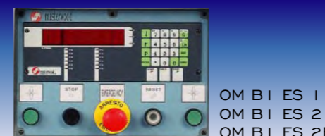
OM BI ES 1 OM BI ES 2 OM BI ES 2B