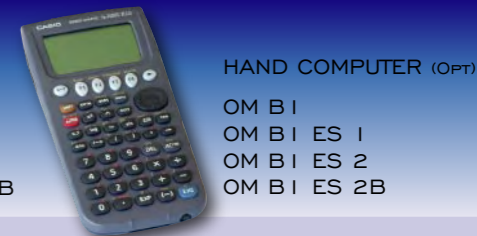
HAND COMPUTER (OPT) OM BI OM BI ES 1 OM BI ES 2 OM BI ES 2B