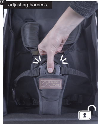
01 adjusting harness