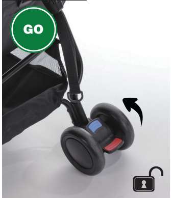
01 foot brake