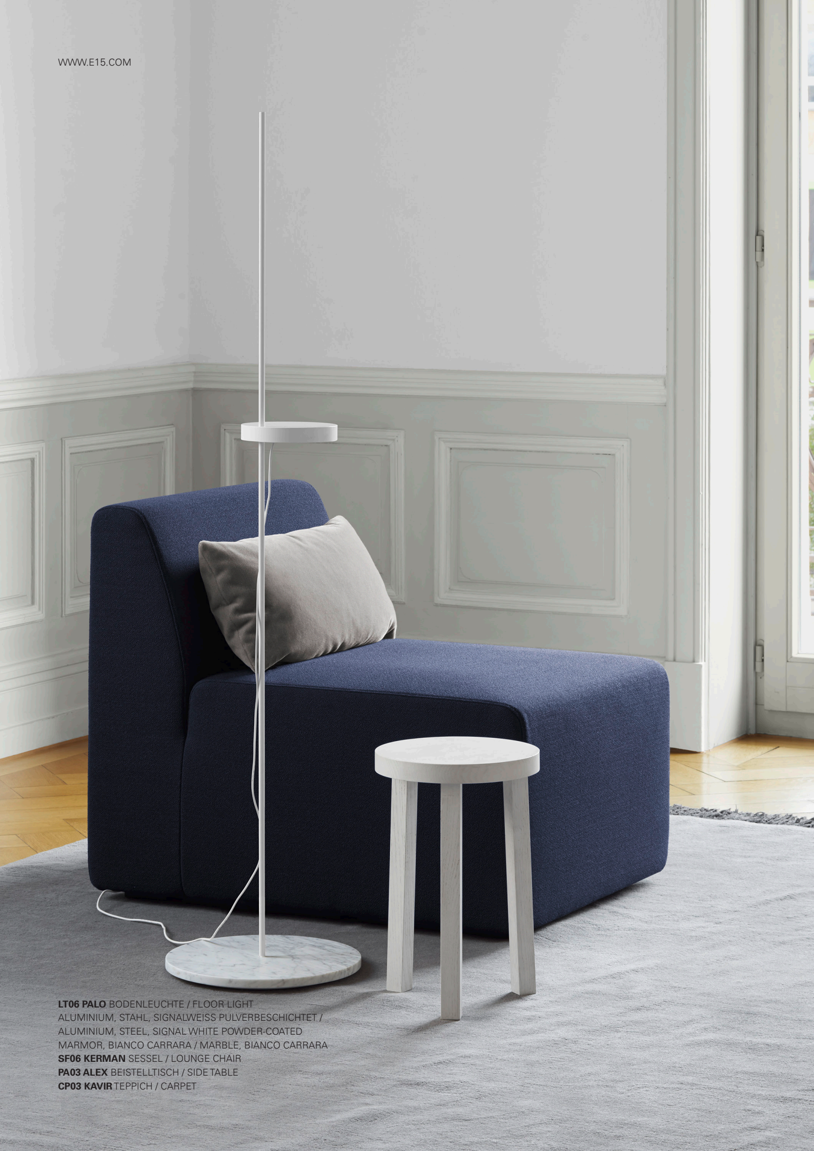
LT06 PALO BODENLEUCHTE / FLOOR LIGHT ALUMINIUM, STAHL, SIGNALWEISS PULVERBESCHICHTET / ALUMINIUM, STEEL, SIGNAL WHITE POWDER-COATED MARMOR, BIANCO CARRARA / MARBLE, BIANCO CARRARA SF06 KERMAN SESSEL / LOUNGE CHAIR PA03 ALEX BEISTELLTISCH / SIDE TABLE CP03 KAVIR TEPPICH / CARPET