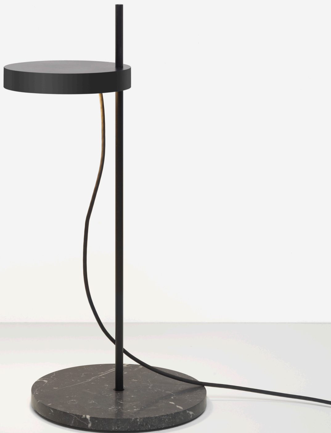
LT06 PALO TISCHLEUCHE / TABLE LIGHT ALUMINIUM, STAHL, TIEFSCHWARZ PULVERBESCHICHTET / ALUMINIUM, STEEL, JET BLACK POWDER-COATED MARMOR, NERO MARQUINA / MARBLE, NERO MARQUINA