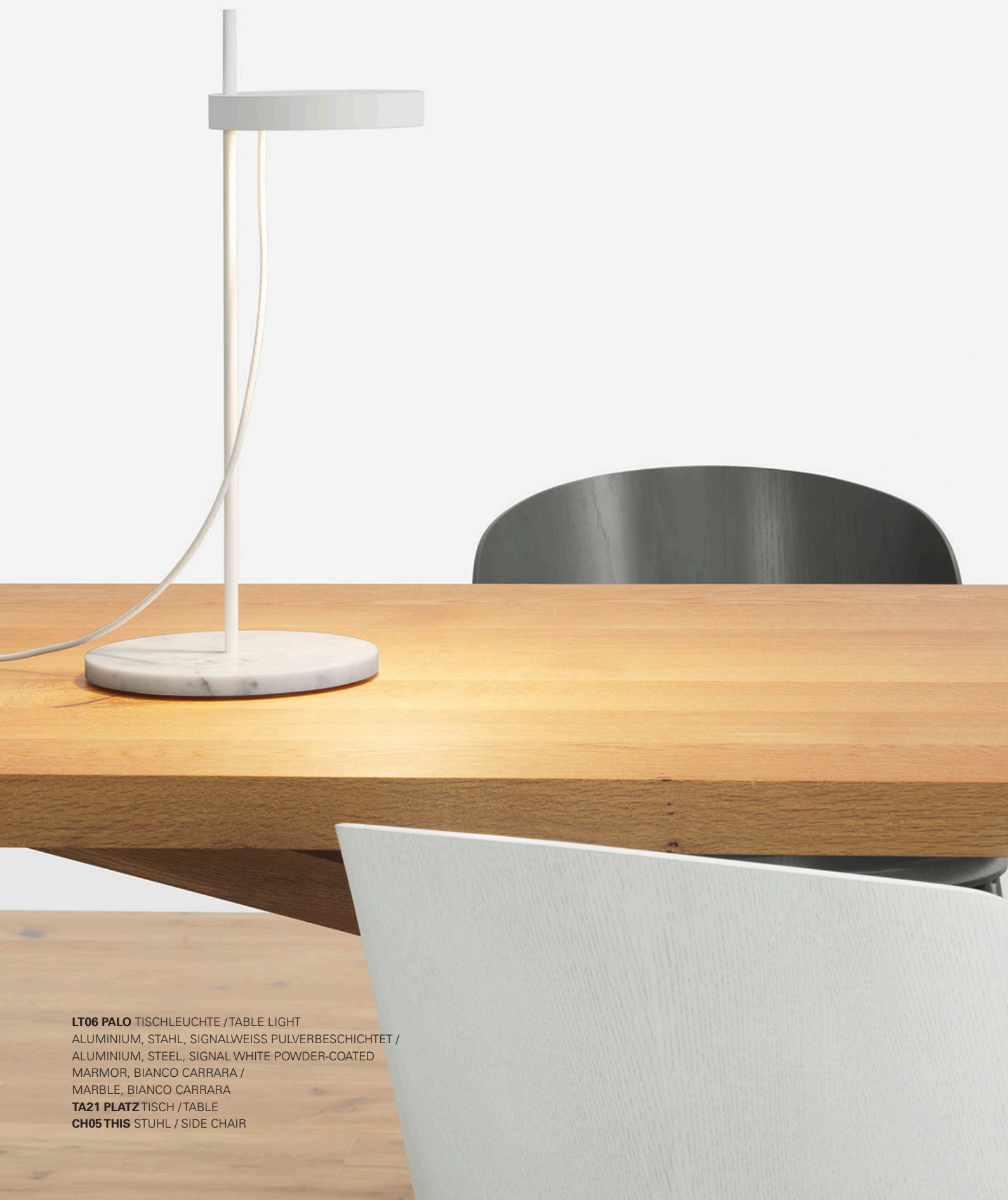
LT06 PALO TISCHLEUCHTE / TABLE LIGHT ALUMINIUM, STAHL, SIGNALWEISS PULVERBESCHICHTET / ALUMINIUM, STEEL, SIGNAL WHITE POWDER-COATED MARMOR, BIANCO CARRARA / MARBLE, BIANCO CARRARA TA21 PLATZ TISCH / TABLE CH05 THIS STUHL / SIDE CHAIR