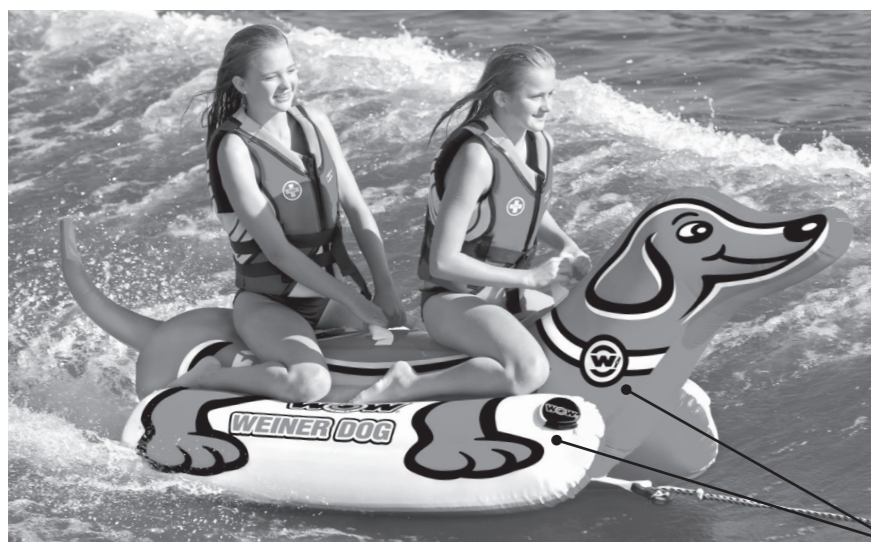
Emplacement de la valve