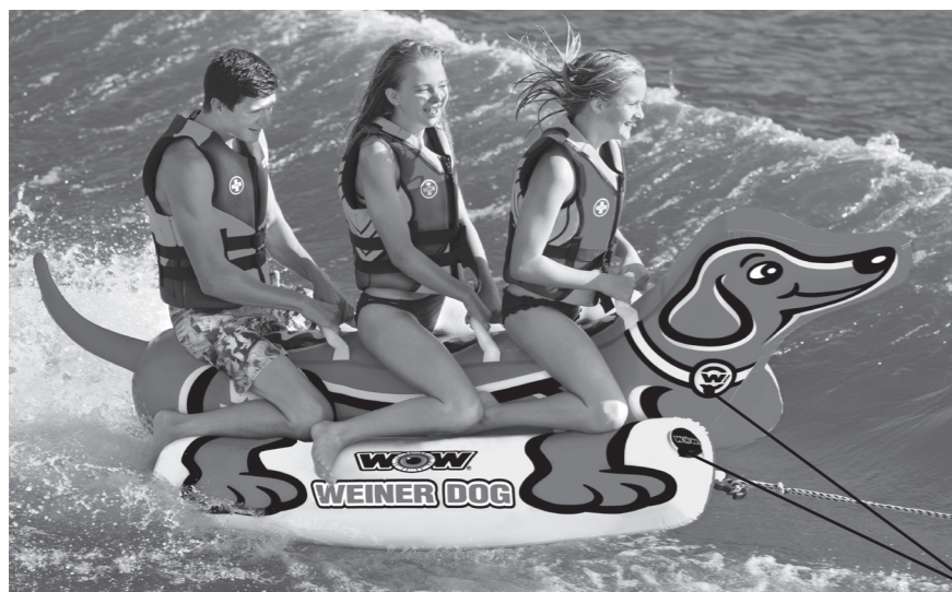
Emplacement de la valve

INSTRUCTIONS DE GONFLAGE : La méthode de gonflage est la clé du rendement et de la durabilité de ce produit. Pendant l'utilisation, la couverture devrait être tendue, avec peu de plis. Si votre produit ne comprend pas de couverture et qu'il est entièrement fait de PVC, gonflez-le jusqu'à ce qu'il soit rigide. Une fois qu'il est gonflé, vous devriez effectuer des tests pour vérifier s'il y a assez de pression d'air, en demandant à un adulte de se tenir debout sur le produit. S'il est suffisamment gonflé, l'adulte s'enfoncera à peine en se tenant debout sur le produit. Si le produit n'est pas suffisamment gonflé, il risque de s'endommager pendant l'usage et la garantie sera annulée. Il est important de surveiller la pression d'air du produit pendant son utilisation. Continuez à vous assurer que le produit est suffisamment gonflé. Lorsqu'il n'est pas utilisé, assurez-vous de dégonfler le produit en partie et de le mettre à l'ombre. Si vous laissez ce produit entièrement gonflé au soleil, l'air qu'il contient prendra de l'expansion, ce qui endommagera gravement les coutures et les poutrelles du produit. Vérifiez et ajustez la pression d'air chaque fois que vous utilisez ce produit.