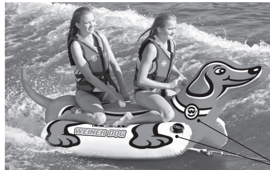
Ubicación de la válvula