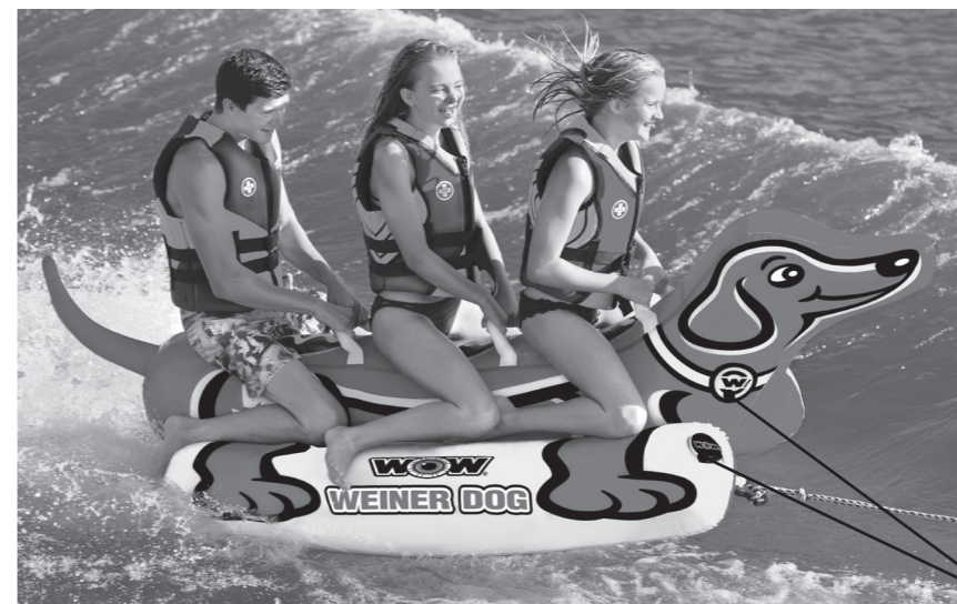
Ubicación de la válvula