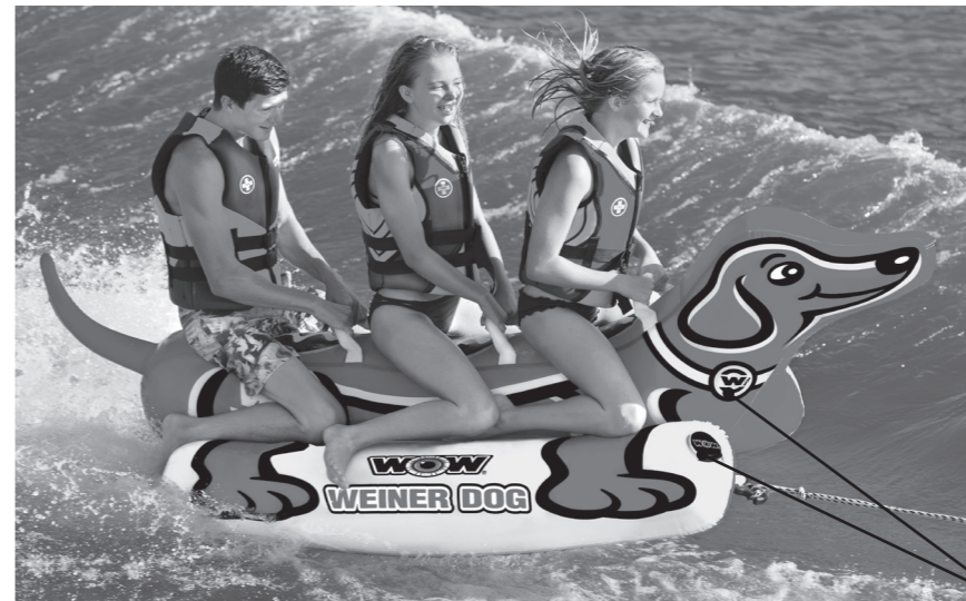
Valve Cover Location