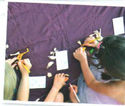
• Animal en bois à monter : 0,90 € sur www.mylittleday.fr

C'est une bonne idée de proposer un petit atelier créatif, peinture ou coloriage pendant le goûter d'anniversaire ! Les enfants adorent... et ça les occupe pendant un moment ! Notre best of ? Les petits kits qui permettent de faire des fouilles archéologiques : il faut déterrer avec soins des ossements de dinosaures. Magique ! Les petits animaux en bois qu'il faut d'abord peindre avant de les assembler rencontrent aussi un grand succès. Chaque enfant a la satisfaction de repartir avec sa création !